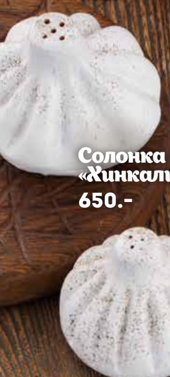
Солонка «Жинкали» 650.-