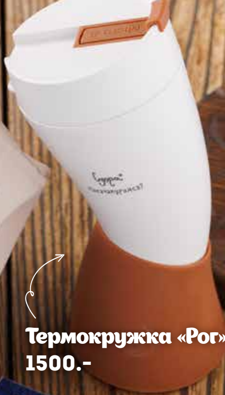
Термокружка «Рог» 1500.-